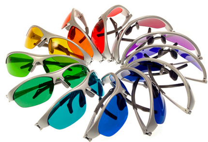
PRISMA カラーライトセラピーグラス